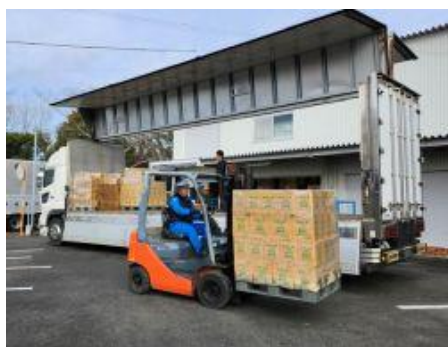
会場に向け積み込まれる備蓄品

住友倉庫グループ及びマグチグループは、2025年大阪・関西万博の物流を支えることにより、万博がめざす「持続可能な開発目標（SDGs）達成への貢献」、「日本の国家戦略 Society5.0の実現」に協力してまいります。